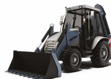
ЭКСКАВАТОРЫ- ПОГРУЗЧИКИ С ОБРАТНОЙ ЛОПАТОЙ